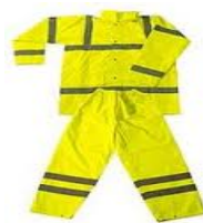
Vêtement de signalisation de haute visibilité de classe 3