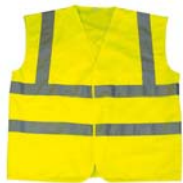
Vêtement de signalisation de haute visibilité de classe 2

La norme EN 471 définit pour chaque type de vêtements, la largeur et la position des bandes réfléchissantes. Il permet à chaque agent intervenant sur la voie publique d'être constamment visible, par tous les usagers de la route.