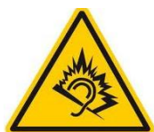
Liés au bruit